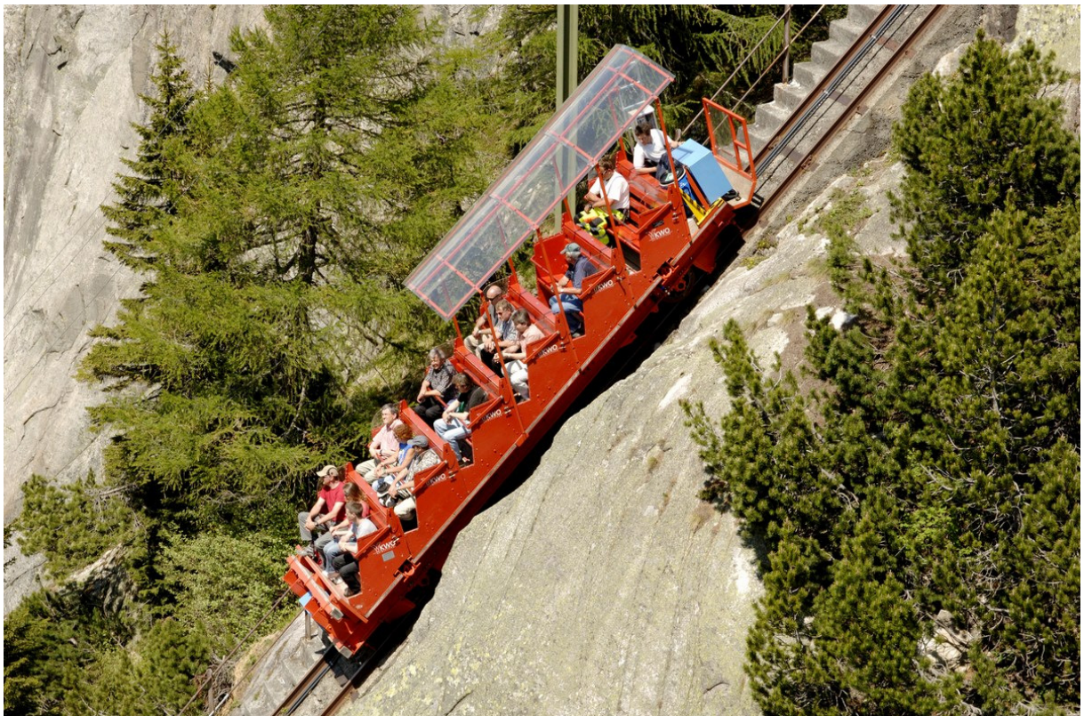
„Swiss Rollercoasting“ von der Grimselpassstrasse zum Gelmersee